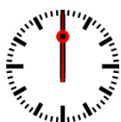
Bild 3: Hahn zu weit gedreht, stoppen Sie bei der letzten Drehung auf 12 Uhr oder nehmen Sie mehr Dichtband beim 2. Versuch.